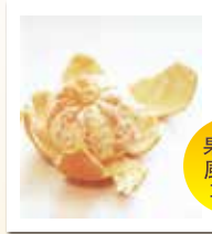
果皮の風味も再現

果肉だけでなく外果皮・中果皮の風味まで添加でき、みかん丸ごと感を演出できます。果汁の供給量不足にお困りの方へおすすめです。