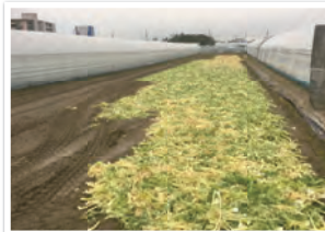
以前は捨てられていた外葉