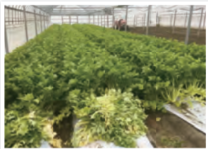
セロリ収穫の様様

国産セロリ末の原料の一部には、静岡県産セロリの外葉を使用しています。この外葉は可食部でありながら、出荷前の重量調整により捨てざるをえず、各農家の方々はこれまで費用をかけて廃棄していました。日本粉末薬品では、それらの外葉を買い取り粉末化することで、食品原料として再利用しています。