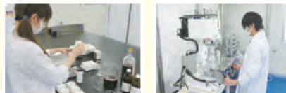
日本粉末薬品株式会社 創造価値開発センター

悩んでいる商品開発のご担当者様、ぜひ日本粉末薬品 までご相談ください。ご希望に合うeエキスをご提案します。 また、弊社創造価値開発センター内では、食品・飲料品の 処方設計から試作まで行っており、お客様の商品開発を 全面サポートします。