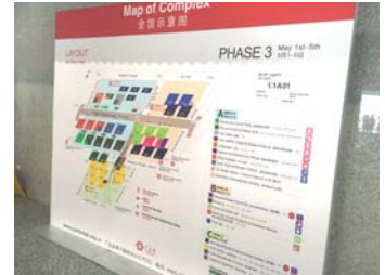
2017年春季交易会データ実績