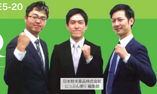
日本粉末薬品株式会社 につぶん便利 編集部