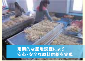
定期的な産地調査により 安心・安全な原料供給を実現

さらに詳しく知りたい方には 交易会報告書をお渡しします! 営業担当までお気軽にお声がけください