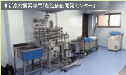
■新素材開発専門「創造価値開発センター」

創造価値開発センターでは、eエキスの新シリーズやその他製品の開発を行うだけでなく、eエキスの本物感を実感していただくためのアプリケーションの製造、処方の検討なども行っています。「こんなeエキスが欲しい」「こんな味にしたいが、処方に悩んでいる」という方は、お気軽にお問い合わせください。