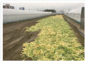
以前は捨てられていた外葉