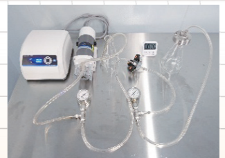
様々なフィルターの組み合わせで試験が可能。