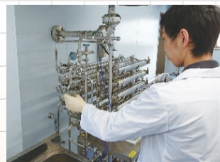
固形や粘度の高いものも殺菌できるチューブ式殺菌機。