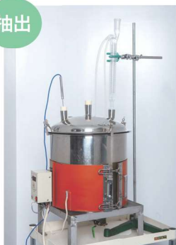
35L抽出釜： 原料仕込み量1~2.5kg/バッチ