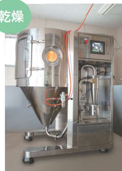
スプレッドライヤー： エキスパウダー製造量:1kg/日